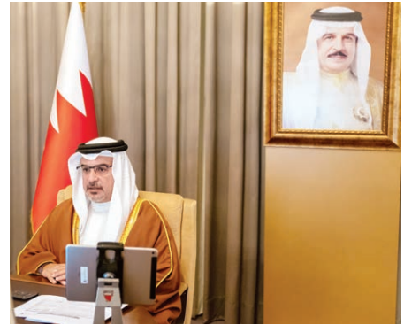
○ سمو ولي العهد رئيس الوزراء يترأس جلسة مجلس الوزراء عن بعد.

« جهاز حكومي يخدم المواطن .. مبادر ومحارب للفساد ومحافظ على المال العام » « تمكين الشباب وزيادة تقدم المرأة وتطوير التعليم والإسكان والقطاع الصحي » « تعزيز الشراكة مع القطاع الخاص وتكثيف الجهود لتعافي الاقتصاد » « لن ننسى المواقف التاريخية للأشقاء في السعودية والإمارات والكويت »