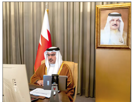
ولي العهد رئيس الوزراء مترشحاً لمجلس الوزراء

وأكد سموه في كلمته التي استهل بها الاجتماع، تعزيز المبادئ التي ترتكز عليها مساعي التطوير، ليكون الجهاز الحكومي، متجاوباً وفعالاً في خدمة المواطن، مبادراً وتميزاً في تطوير البيئة التنافسية وخلق الفرص، وتبنياً للتقنيات الحديثة لتسريع الإنجاز بكفاءة ومهنية وشغافية، محارباً للفساد.