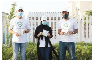
دعماً لحملة بلدية الشمالية، حياك ترخص لك،

ما قامت به وزارة الداخلية درس جديد للعلم الوطني العام، نثق تمام الثقة أن كافة المؤسسات والوزارات حرصت على تنفيذة والافتقار به، وفق إرادة وطنية، ومسؤولية واضحة.