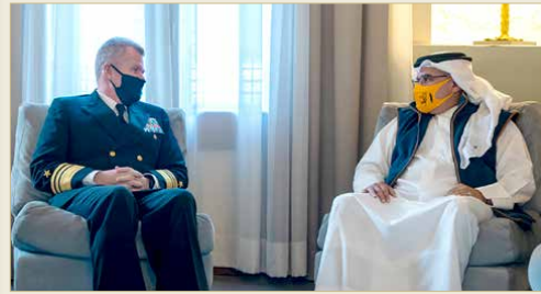
المتنمة - بنا أكد ولي العهد نائب القائد الأعلى رئيس الوزراء صاحب السمو الملكي الأمير سلمان بن حمد آل خليفة على عمق العلاقات التاريخية الوطيدة التي تجمع مملكة البحرين والولايات المتحدة الأميركية الصديقة وما وصل إليه التعاون الثنائي المشترك من مستويات متقدمة في كافة المجالات خاصة في المجالات العسكرية والدفاعية. جاء ذلك لدى لقاء سموه في قصر الرفاع أمس 2020 والتنسيق البحري بقيادة المركزية الأميركية قائد الأسطول الخامس الفريق بحري صمويل بابارو، حيث أكد سموه أهمية مواصلة تعزيز التعاون والتنسيق المشترك بين مملكة البحرين والولايات المتحدة الأميركية الصديقة على مختلف الأصعدة لما فيه خير وصالح البلدين والشعبين الصديقين وبما يسهم في تحقيق

◆ سمو ولي العهد رئيس الوزراء: مستويات التعاون العسكري مع أميركا متقدمة