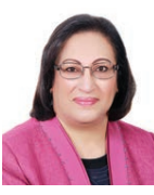
○ وزيرة الصحة.

أشادت وزيرة الصحة الأستاذة فائقة بنت سعيد الصالح بتوجيه صاحب السمو الملكي الأمير سلمان بن حمد آل خليفة سمو ولي العهد رئيس الوزراء لتخصيص عدد من مقاعد الممرجات لعوائل العاملين في الصفوف الأمامية من الكوادر الصحية والجهات المساندة الأخرى لحضور سباق جائزة البحرين الكبرى لطيران الخليج للفورمولا وان وسباق جائزة ويلكس للفيوثيربي، ورثقا عن عطفهم بمساهمتهم والمسؤولين والعاملين لحرصهم الدائم على