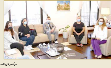
مؤتمر في السفارة الإيطالية

حمية البحر الأبيض المتوسط الغذائية، الذي يصادف الذكرى العاشرة منذ أن أعلنت منظمة اليونسكو أن حمية البحر الأبيض المتوسط تراثاً ثقافياً غير ملموس إنساني.